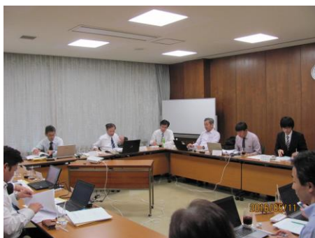
調査研究部会・会議風景

平成28年度は5回の部会及び1回のWGを開催し、昨年度に設定した統合生産システムのモデルラインについて、安全設計上必要となる実施項目の検討を行った。具体的には、統合生産システムの設計に必要な観点、規格適合及びリスクアセスメントに必要な観点、作業分析（作業と作業ゾーン）、制御範囲の分析と決定などについて検討し、その結果をガイドラインとしてまとめた。