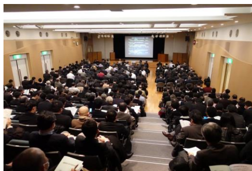
講演会・聴講風景